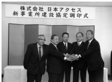
企業立地の調印式（H21.4.28）

の一部を受給者本人が負担する一部負担金の導入を実施するとともに、父子家庭の世帯を新たに助成対象に加える見直しが行われた。 本市としては、医療費の助成については、市民生活に密接にかかわることから安心して医療にかかることができる福祉医療制度の継続を実施していきたい。 現在、体制づくりを行っており、関係機関との調整や市民への周知を十分に行っていくたい。 その他の報告 このほか、山口市地域新エネルギービジョン及び山口市バイオマスタウン構想の策定、山口市バリアフリー基本構想、ターミナルパーク整備、企業立地、平成20年度一般会計の決算見込みについての報告がありました。