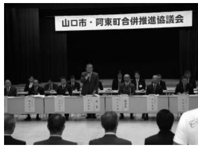
第1回合併推進協議会 (山口市市民会館小ホール)

また、第3回推進協議会では、合併後のまちづくりの基本指針とプロジェクト事業及び財政計画を盛り込んだ新市基本計画の素案を提案し、現在、この素案について、6月1日から1カ月間、パブリックコメントを実施し、両市町の住民の意見、提案を募集しているところである。