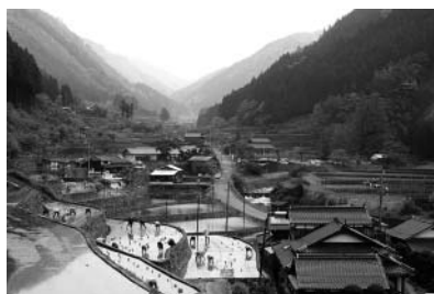
活性化が望まれる中山間地域

執行部からは、専門性のある部分については、所管の部局で対応することとなるが、定期的に会議を開催するなどし、各部局の意見を聞きながら中山間地域活性化推進室がコーディネーター役となって取り組んでいるとの答弁がありました。また委員から、中山間地域活性化に取り組む方向性あるいは計画を市民にわかりやすく示して欲しいとの意見が出され、執行部から、すぐには難しいかもしれないが、今後、解決に向けた方向を出して行きたいとの答弁がありました。 なお、総務委員会に付託された11件の議案は、すべて全会一致で可決しました。