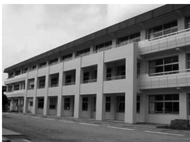
平成20年度に耐震補強した平川小学校校舎

執行部から、本市の学校施設の耐震化については、小・中学校で、平成19年度から「山口市学校施設耐震化推進計画」に基づいて取り組んでおり、幼稚園を含む全施設の第2次耐震診断(設計書及び現地調査により柱と壁等の強度を調べ、建物の粘り強さを診断)を平成20、21年度の2年間で