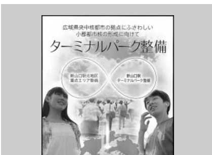
全戸配布されたリーフレット