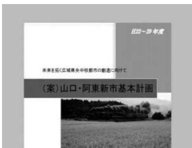
(案)山口・阿東新市基本計画

こうした中で本特別委員会としても、これまで3カ月の間、9回にわたり委員会を開催し、協議会の協議事項である協定項目等の調整の方向性、山口・阿東新市基本計画(案)、議会議員の定数及び任期の取り扱