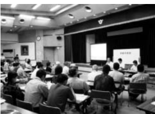
20力所で開催された移動市長室(徳地山村開発センター)

次に委員から、合併に対して市民が期待感を持てるような説明を工夫すべきではないか、また現実に法定合併協議会設置に向けて