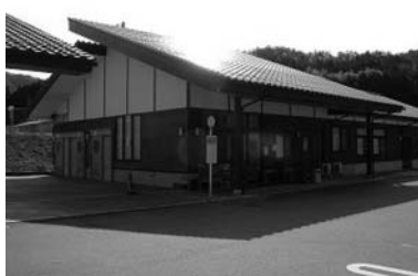
山口市地域活性化センター(徳地柚木)

した者が指定管理者になる場合でも、3年に一度はその事業を見直し、議会の議決を得ることも考えてほしいとの意見がありました。