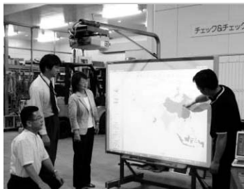
電子黒板の説明を受ける公明党市議団

今議会に上程された「議案第26号」は平成21年度一次補正予算で創設された「地域活性化・経済危機対策臨時交付金」で、地球温暖化対策、少子高齢化社会への対応、安心・安全の実現、その他将来に向けた地域の実情に応じた事業を市内事業者に発注し、地域活性化を図ることを目的としている。今回計上されている「学校ICT環境整備事業」の中の地上デジタル放送対応機器の一つ「電子黒板」を体験し、関係者から話を伺った。