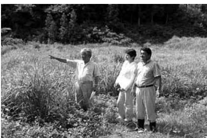
雑草が生い茂る耕作放棄田に立つ市議団3人

児童クラブ運営費、私立幼稚園就園奨励費、産科医等確保支援事業費、救急業務推進事業費等が主でした。