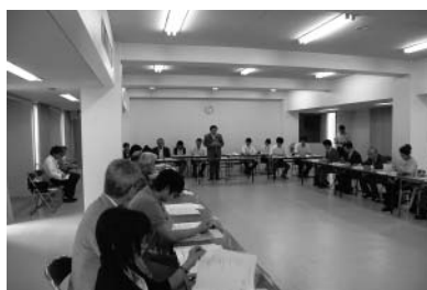
山口市協働のまちづくり推進委員会

具体的な取り組みとしては、市内20地域の従来の公民館・出張所機能に地域づくり機能を付加した地域交流センターを設置するとともに、地域づくり運営支援交付金及び地域づくり活動支援交付金の拡充を図り、地域主体の取り組みへの支援体制の整備を行ったところである。