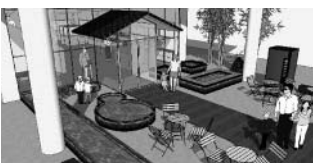
「湯田温泉体験館」イメージ図

問 まちづくりの方向性は。 答 まず街路、公園等しっかりと修景美装化すること、人の回遊や食文化を創出するような施設等の出店を促し、これらをソフト事業と組み合わせた散策の動線づくりによって、ゾーン全体を面的に整備する。地域の皆様との協働により、湯田温泉がにぎわいのある特別な価値を持つ場所になるように、全力で取り組む。