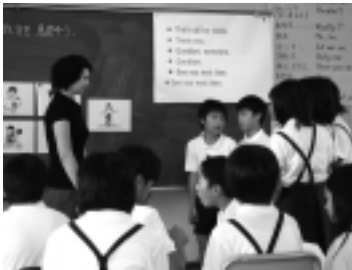
外国語指導助手による授業風景

委員からは、国が定めた学習指導要領なので、市の一般財源だけで事業を実施するのではなく、県、国へ負担するように要求すべきではないかとの質問がありました。