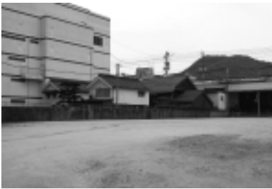
商店街にぽっかりとあいた、巨大な空間

建設については中市商店街振興組合が行い、そのあとの運営を株式会社街づくり山口が担う。同社では施設運営を行うための体制づくりが行われると考える。設計及び建設については国土交通省の暮らし・にぎわい再生事業補助金を活用し、本年度に基本設計及び実施設計、来年度から建設工事を行い、平成22年秋の開業を目指す。