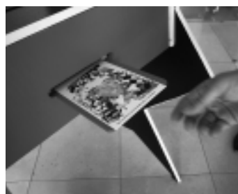
参加者のオリジナルレポート

山口情報芸術センターを視察し、湯田アートプロジェクトについて説明を受けました。温泉街を舞台に、観客参加型作品で、参加者のオリジナルレポートが作れます。