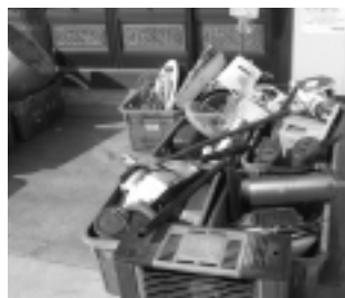
排出された家庭系廃棄物

委員からは、改正条例の施行日までの期間が短いことや山口市資源回収推進事業との関連などについて質問があり、執行部からは、市民に混乱が起らないよう改正内容の周知徹底と現場指導を行い、資源回収推進事業や分別・資源化との関係について、自治会や関係団体等を通じて、鋭意取り組むとの説明がありました。