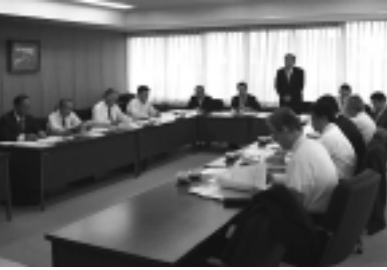
戸田市での視察風景

本委員会では9月24日から9月26日にかけて、議会運営と議会活性化の取り組み及び政治倫理の規定について調査するため、栃木県足利市、茨城県つくば市及び埼玉県戸田市を視察しました。