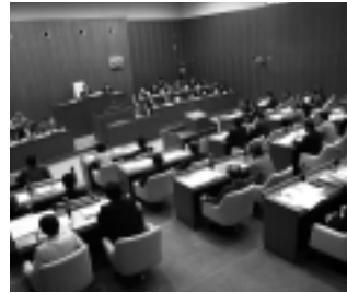
9月定例会本会議の様子