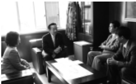
岩城教育長に要望する公明党議員団

また、学校給食の調理業務の民間委託についても議論し、公明党としても、低コストで安心・安全で、そして美味しい学校給食の安定的な提供を強く要望しました。