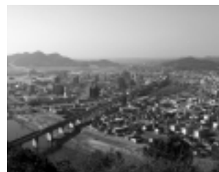
産業交流拠点の強化が 期待される小郡地域

市民に公開し、共有化を図 るとともに、中心市街地の 活性化や新山口駅ターミナ ルパーク整備等、広域圏中 核都市にふさわしい拠点 の形成に努めていきたい。