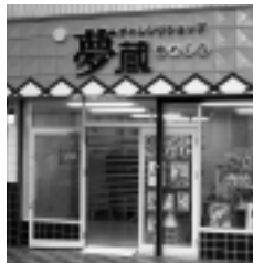
チャレンジショップ「夢蔵」

募集し、1店舗の出店だが、4店舗の出店に向けた今後の取り組みについて質問がありました。 執行部から、先日審査会が開催され、2店舗の出店が決定し、開店に向け準備されている。残り1店舗の早期入店に向け、今後とも街づくり山口と山口商工会議所において広報活動などにより努力いただくこととしているとの説明がありました。