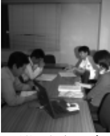
政策研究グループ

研究を進めることは有意義であり、成果を検証してさらに積極的に取り組んでほしいとの意見がありました。